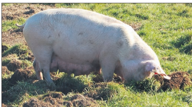
Søerne har travlt med at rode i jorden og æde græs og rødder hele dagen, selv om de kan æde alt hvad de vil i foderautomaterne.

get på den dyrevelfærdsmæssige side, mens Jesper Adler holdt fast i, at man også skal kunne leve af det.